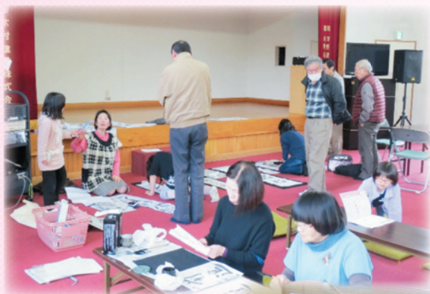
子どもと一緒に書き初め

中大塩地区では、かねてより一部住民から強い要望が上がっていた“集いの場”が、住民有志により立ち上がり、地区社協が後援しています。「みんなが集まれる場所の提供で、ゆるやかな仲間づくりを目指す」ことを目的に、毎月2回(5日・20日)、飲み物代1人100円(高校生以下無料)を集めてドリップコーヒーなどを提供する『ゆるなかカフェ』を始めました。オセロやトランプ、書き初め、おしゃべりなど、“おもてなし”ではなく、 参加者自らが思い思いの時間を過ごしています。