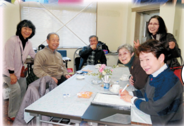
おしゃべりに花が咲きます