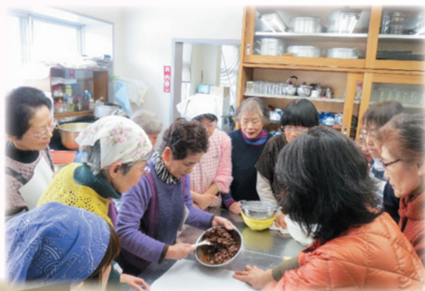
バレンタインデーに向けて チョコレートバー作り