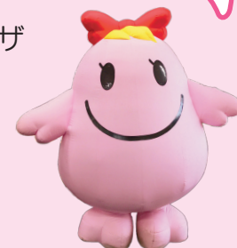
赤い羽根共同募金「愛ちゃん」