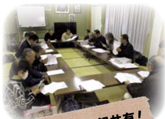
ごちゃませて情報共有！