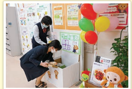
八十二銀行茅野駅前支店での 食料品受付の様子