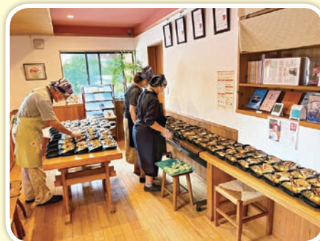
子ども食堂の活動団体へ