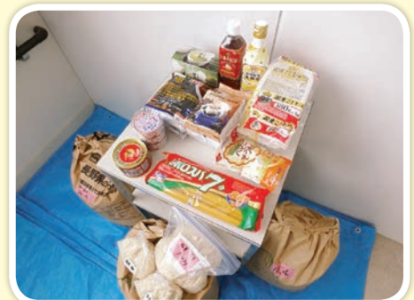
市内の生活に困っている 家庭などへ

コロナ禍で収入が減ってしまった人、仕事を失ってしまった人など、日々の暮らしに困る人がこれまでになく増えています。その対策として給付金の支給や生活費の無利子貸し付けなど、制度による支援も行われてきました。それに加えてフードドライブの活動をはじめとする、市民による支援が大きな力となっています。一人ひとりができることは小さくても、みんなの思いやりの行動が多くの人の暮らしを支えています。