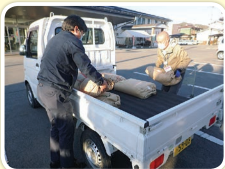
様々な理由で生活に困っている 方を支援している団体へ